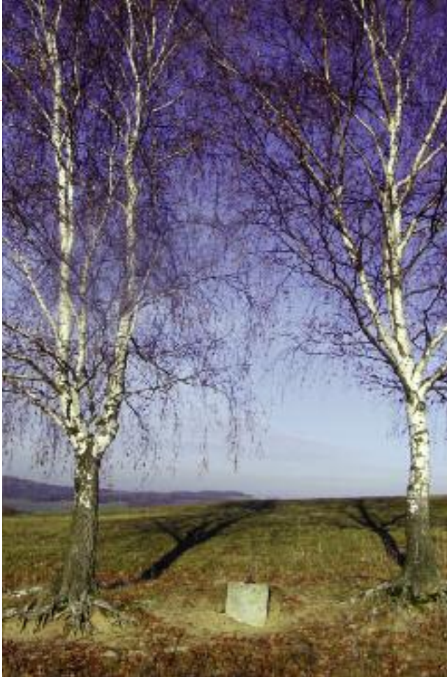
Křížek u cesty přežil léta komunismu, nepřežil však zemědělcé, který má na pastvinách krávy. Krávy, které si o kříž drbaly záda, ho za pár měsíců ulomily. Stejně tak dopadly další dva křížky v okolí. Okrouhlice, Benešov u Prahy.

Ti, kdo dnes krajinou chodí, nebo spíš jezdí v traktorech, kdo ji obdělávají, jsou daleko více strojníci a řidiči, plánování sklizně se děje kdesi u stolu, po poli se pěšky nechodí, je tam bláto, tak co tam. Krajina už nějak není vnitřně naše, všimli jste si také, že pokud jedete autem, okreskami mezi vesnicemi se často po silnicích procházejí maminky s kočárky a lidé se psem? Kam také jít, když všude kolem je hluboká orba, cestu na pole za sebou zaoral odjíždějící traktor a tak jediných volně průchozích sto metrů tam a zpět na usnutí dítěte je silnice. Jakoby krajina přestala být domovem a odpovědnost za její stav převzal někdo jiný a ten by měl vysázet alej, prořezat planící stromy u cesty a opravit boží muka. Je to ale vůbec ještě dnes k něčemu? Na co alej, když cesta polem již zanikla a nikdo po ní nechodí, kdo by dnes jedl kyselá jablka staré jabloně a pro těch pár svíčkových bab je škoda křížek opravovat. Není ale řešením nakoupit z dotací kraje/ EU/ MŽP/ .... stádo ovcí, založit pár mezí a dívat se na romantický obraz z doby Jindřicha Šimona Baara a Boženy Němcové. Pak by jen chybělo, aby k absurdnímu obrazu skanzenu byli najímáni herci, kteří by se převlékli do krojů, kolem by se proháněli Sultán a Tyrl a komisař EU by dohlížel, zda se to vše shoduje s domácí tradicí. Pak by se v plné pravdě ukázala věta Ivana Dejmala, že „harmonická“ kulturní krajina je prožraným svrchníkem po dědovi.