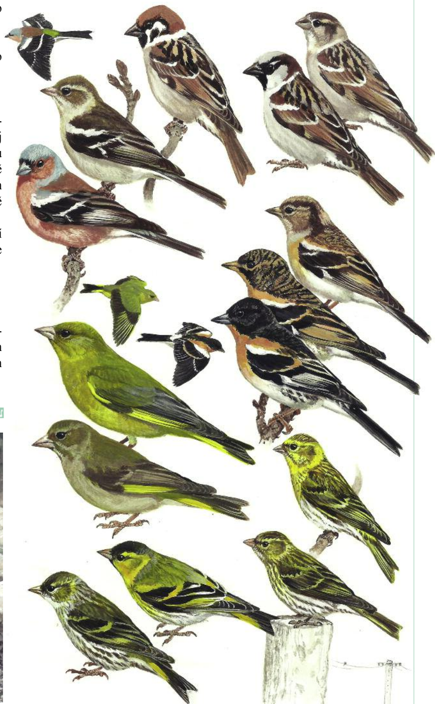
▼ Pěvci, Příroda České republiky, Academia, 2007