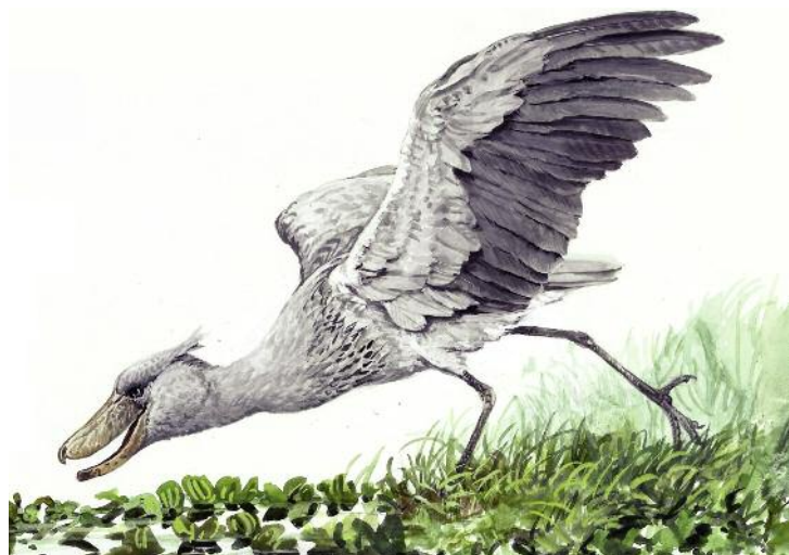
▲ Člunozobec nilský lovící kořist – pro informační systém Zoo hl. m. Prahy