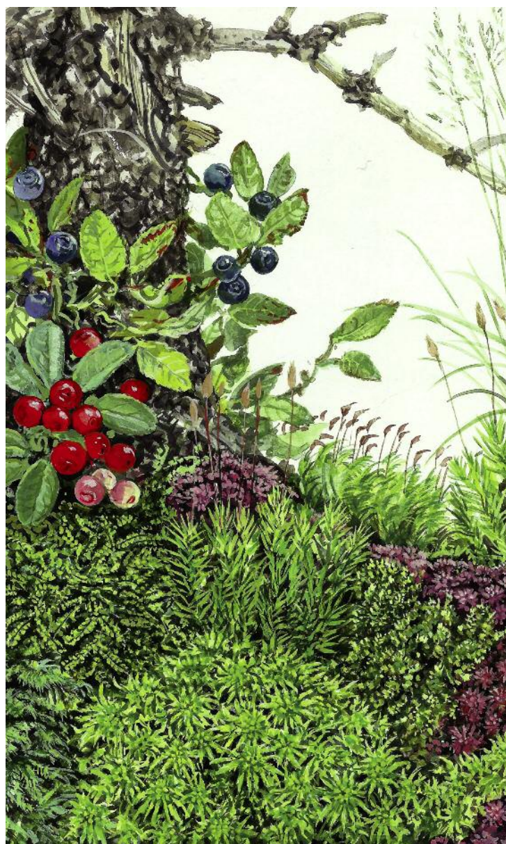
▲ Rašelínkový koberec s rostlinami v rašelinném lese, interaktivní materiál Šumavská rašeliniště pro středisko ekologické výchovy při NP a CHKO Šumava.