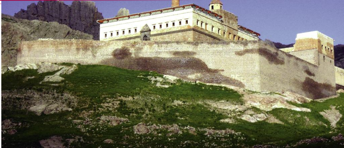
Celkový pohled na palác Ishak Pasha