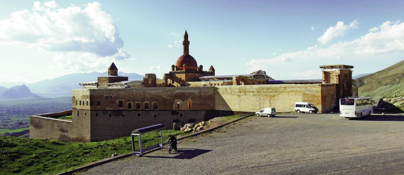
Palác Ishak Pasha z nadhledu

Ararat v plné kráse, tentokrát bez své obvyklé mračné čepičky