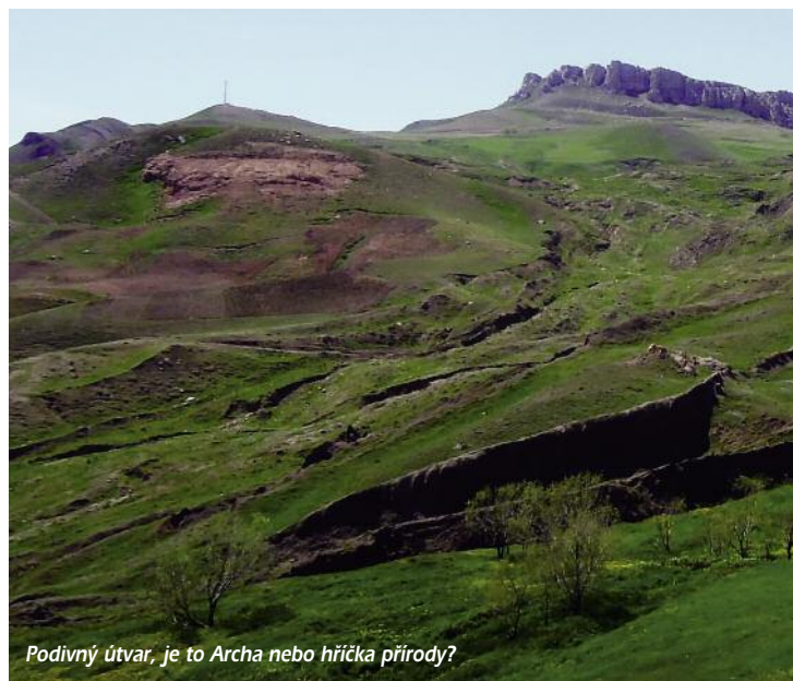
Podivný útvar, je to Archa nebo hříčka přírody?

Ráno bylo milostné, modré nebe, nikdo nás nevyhodil a navíc ze spacáku výhled na sluncem ozářený Ararat. Po sbalení věci nás místní dobrodinec, využívajíc zaklínadlo „No problem“, odvezl na stejné místo, kde začala včerejší anabáze. Nakonec jsme vsadili na jistotu a najali si taxi. Ovšem nejprve jsme úspěšně usmlouvali cenu, protože jsme již dobře věděli, že k Arše to není 100 km, jak tvrdil řidič, ale necelých dvacet. Tam i zpět a asi půl hodiny čekání na místě za 50 lir, tedy necelých 600 Kč. Nastala stejná cesta jako včera večer, ale vojenské zátarasy byly průjezdné. Vedlejší prašná silnička k Arše je strmá. Toyota jela na jedničku a to sotva, ale těch asi 6 km odbočky od hlavní, navíc do nadmořské výšky asi 1900 metrů, vystoupala. Sem tam stádo ovcí, jinde vojenský objekt, kulometné hnízdo a najednou dost. Parkoviště a podivná, červená stavba, to je malé muzeum a návštěvnické centrum z roku 1988, odkdy na něj nikdo nesáhl. Od budovy je krásný výhled na Ararat. V okolí je na jedné straně horská stráž, na opačné rozsáhlé údolí pod vyhaslou sopkou, uprostřed něho neobvyklý útvar, Archa, konečně.