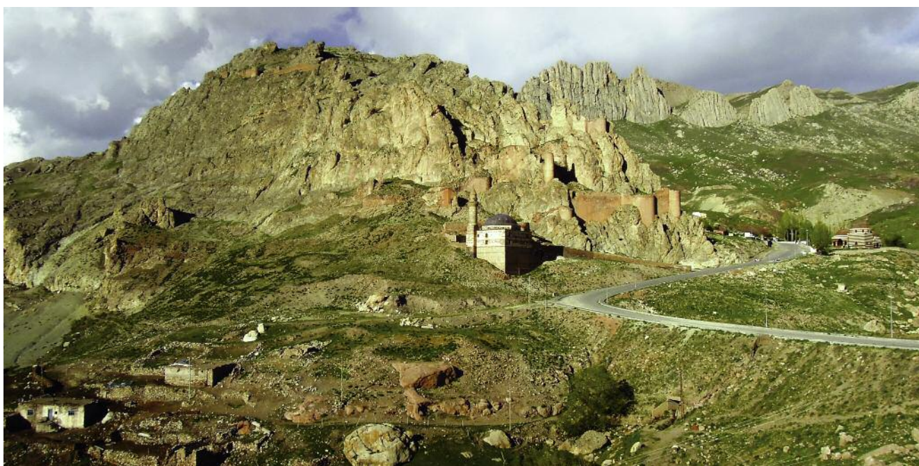
Silnice z města Dağubeyazi tu směr hory