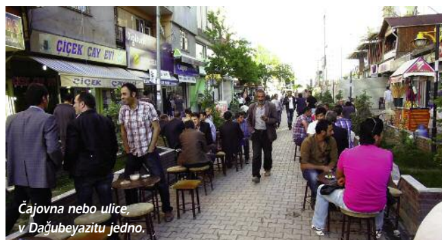
Čajovna nebo ulice, v Dağubeyazitu jedno.

Netřeba snad připomínat příběh o Noemovi, zkaženosti lidstva, božím hněvu, Arše, potopě a záchraně. Vše se mělo odehrát v roce 2104 před naším letopočtem, zde se pověsti rozcházejí, nicméně základ zůstává zachován, například i v Eposu o Gilgamešovi. Pro nevěřící se až do roku 1959 jednalo o pouhou legendu z Bible, ale toho roku, při kontrole leteckých snímků z mapovacího projektu NATO, našel turecký armádní kapitán L. Durupinar podivný útvar připomínající velkou rozpadlou loď. Vyvýšenina, tedy onen neobvyklý útvar je dodnes označován jménem svého objevitele. Ale co důstojník tehdy objevil, není dodnes spolehlivě vyjasněno.