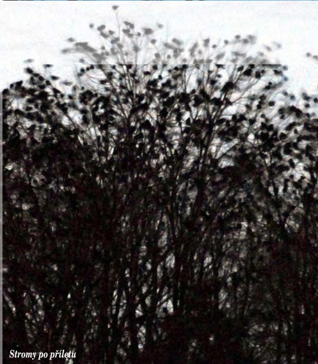
Stromy po přeletu

jedinců, poznávacím testem s použitím vycpanin i soutěžní hra o ceny, která ověří nově získané vědomosti dětí.