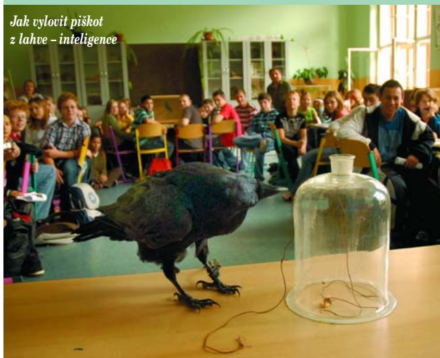
Jak vylovit piškot z lahve - inteligence