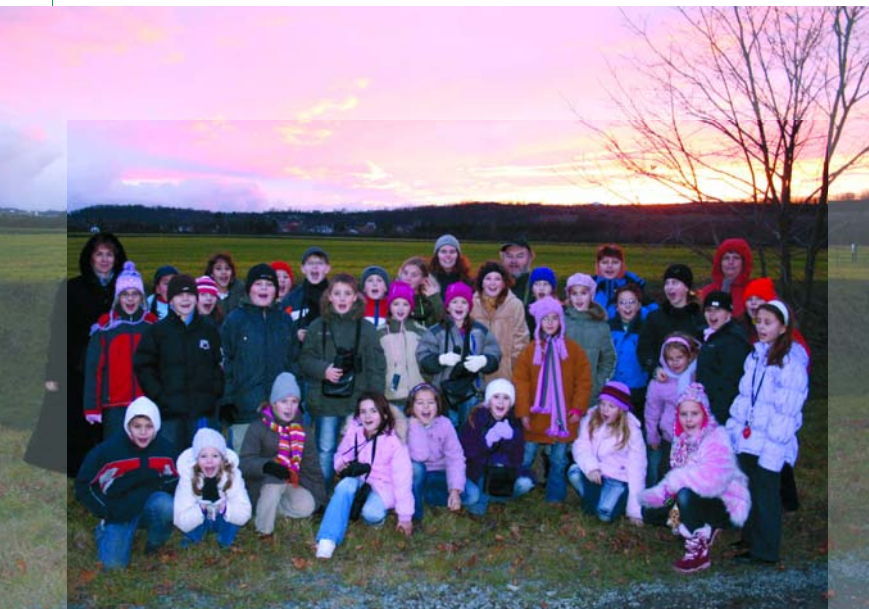
Západ nad nocovištěm

Pozorovat tyto večerní rituály je velmi působivý zážitek nejen pro ornitology, ale i pro dětské účastníky a pedagogy. Během jediného odpoledne všichni získají vědomosti a přímou zkušenost s chováním tak nepřehlédnutelného druhu ptáka, jako je havran polní. Jsou jim známy souvislosti s migrací havranů a kavek v Evropě a rozhodně už si nikdo z účastníků nesplete vránu s havranem. Zážitek s černou oblohou lze získat každý den, protože ptáci tyto rituály činí od nepaměti a bez ohledu na počasí. Exkurzi však lze objednat jen v období od listopadu do půlky března, kdy nás tyto zimující ptáci opustí a vrátí se zpět do "své" země, respektive do oblasti, kde každoročně hnízdí a vyvádějí svá mláďata. A počátkem listopadu se celý kolotoč migrací zase zopakuje.