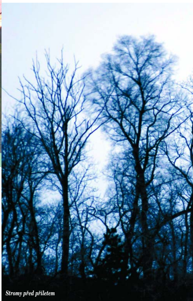
Stromy před přiletem

Přednášky probíhají vždy ve škole, jejich počet v jednom přednáškovém dni je maximálně 6 v rámci 6ti vyučovacími hodinami. Minimální počet účastníků přednáškového dne je 150 dětí, maximální počet je 300 dětí. Počet dětí na jedné přednášce je tedy maximálně 50. Přednášky neprobíhají v tělocvičnách, ale ve třídách. Pro děti je připraven nabitý program s ukázkami živých ochočených