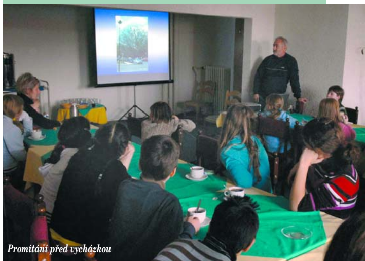
Promítání před vycházkou