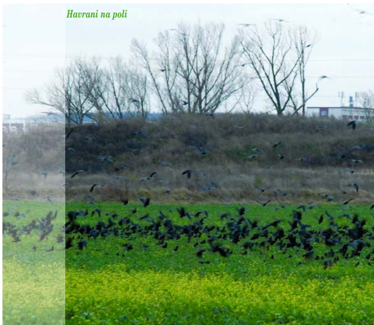
Havrani na poli

Ptáci se navečer slétají v menších hejnech a skupinách z různých stran a každý den volí jiné místo pro společné „shromáždění“. Někdy na poli, jindy vysoko v korunách stromů ve vilové zástavbě, někdy zas v prostorách průmyslových areálů, ale i přímo v centru města Kralupy či v zahrádkářské kolonii. Každodenní změnu shromaždiště dělají pravděpodobně pro zvýšení své bezpečnosti. Teprve po setmění se postupně celé hejno zvedne a v tichosti letí, jako černá řeka na obloze, až do odlehleho svahu nad Vltavou poblíž zámku Nelahozeves, kde každou noc vysoko v korunách stromů společně přespí.