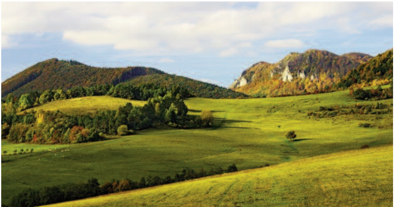
Obraz typickej bielokarpat- skej krajiny z okolia obce Lednica